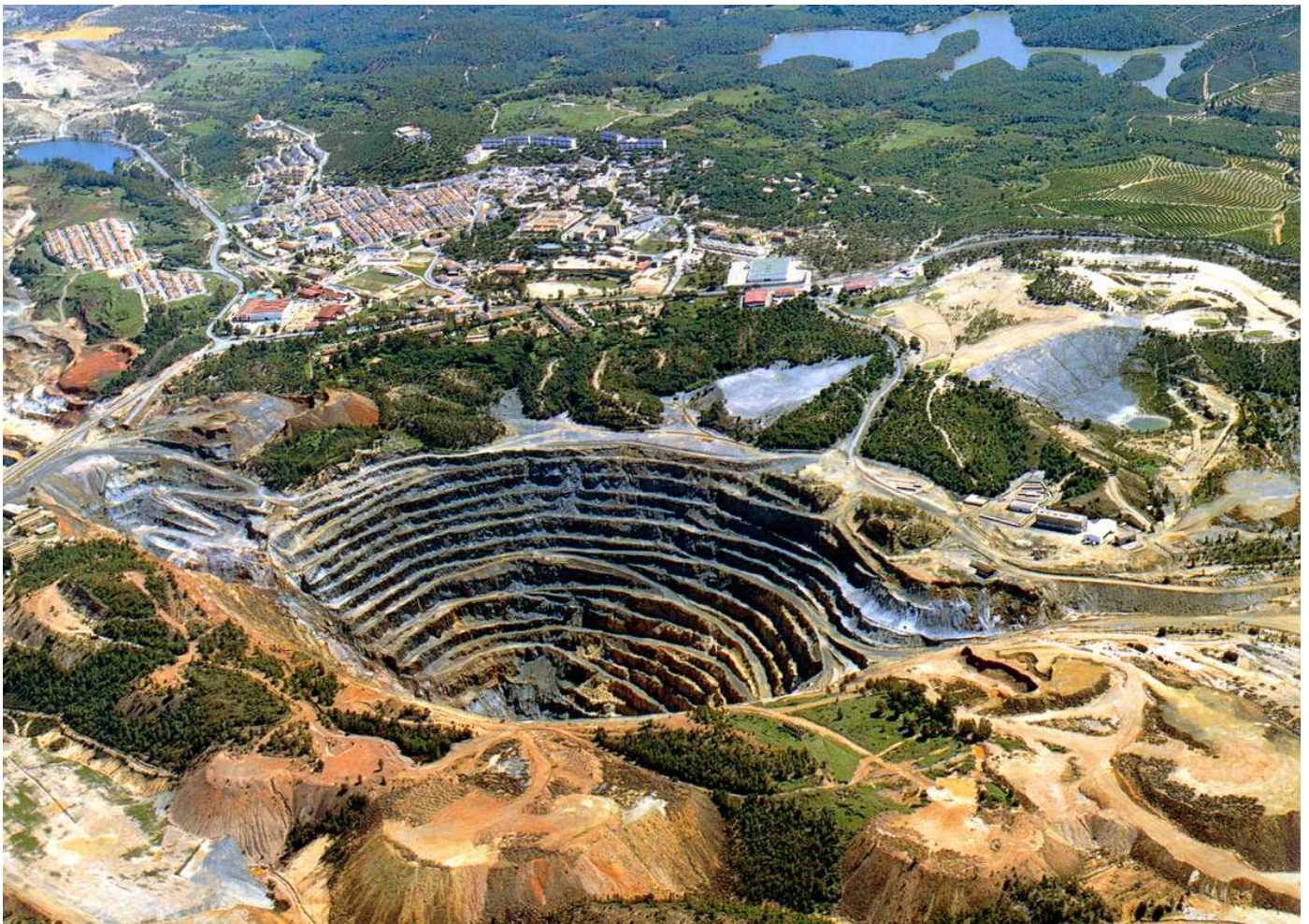
Figura 2. Corta Atalaya. (Fuente: www.econavideno.com ).